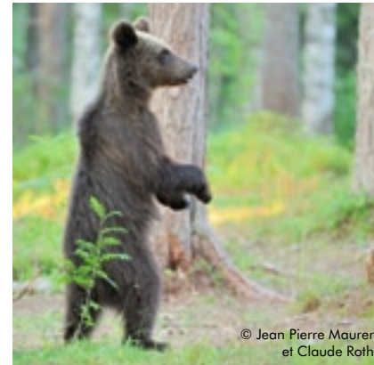
© Jean Pierre Maurer et Claude Roth